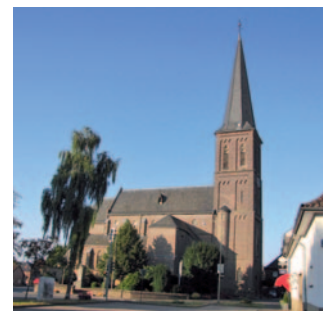
St. Adelgundis Arsbeck

immer am 1. Dienstag im Monat um 17:00 Uhr im Pfarrheim