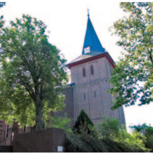
St. Peter und Paul Wegberg