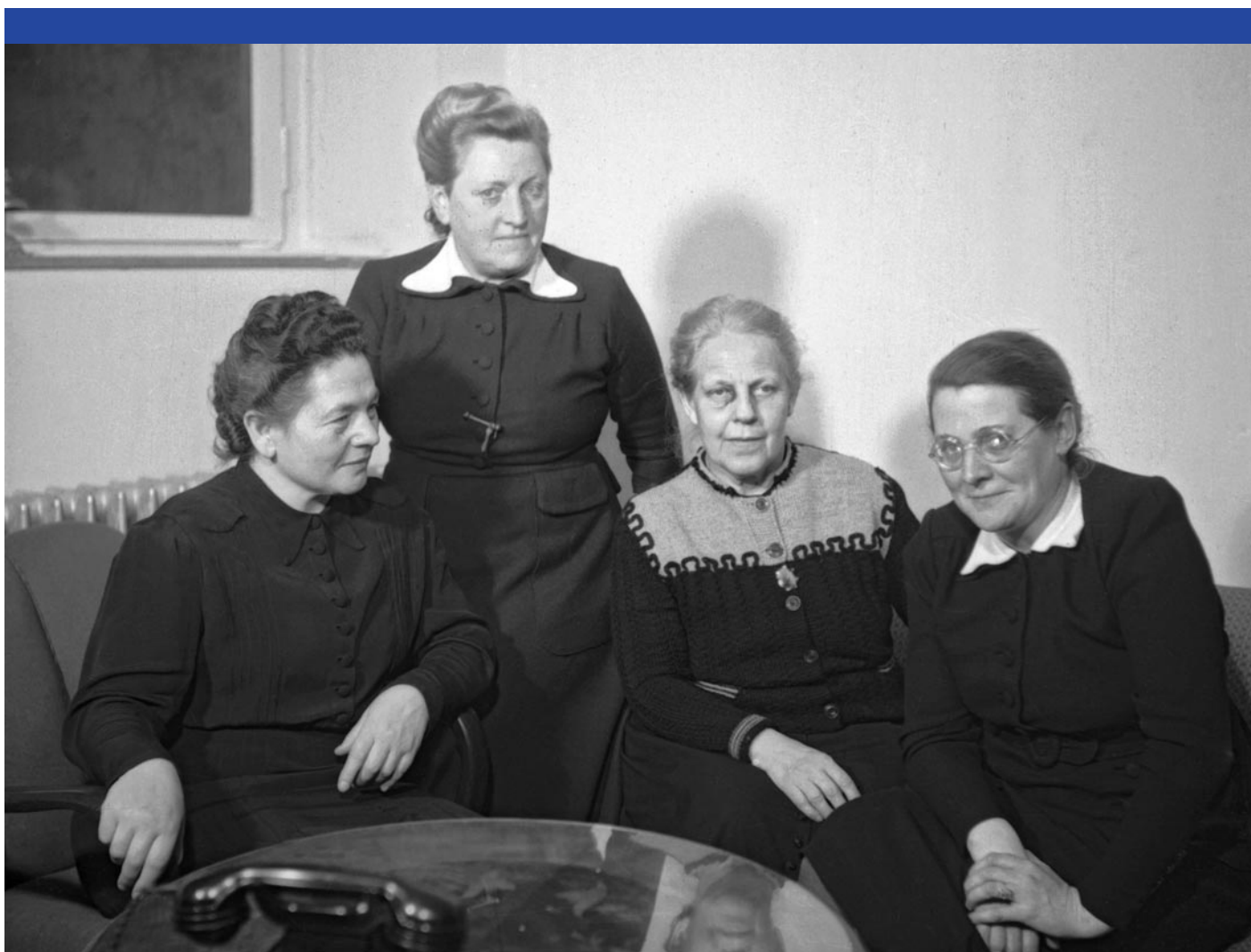
Frieda Nadig, Elisabeth Selbert, Helene Weber und Helene Wessel (von links) sind die vier Mütter des Grundgesetzes.

Prof. Carlo Schmid, Jurist und prägender Autor der Verfassung, am 08.09.1948 im parlamentarischen Rat