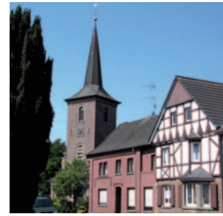
St. Rochus Rath-Anhoven

So 05.05. 08:00 Wortgottesfeier f.d. Gemeinde Di 14.05. 17:30 Hl. Messe So 19.05. 08:00 Wortgottesfeier f.d. Gemeinde So 02.06. 08:00 Wortgottesfeier f.d. Gemeinde