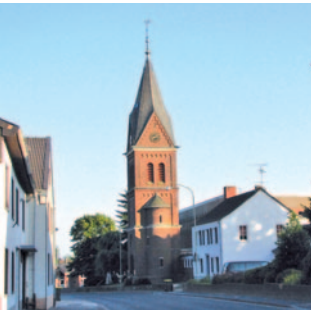
St. Johann Baptist Wildenrath