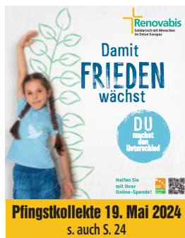
Pfingstkollekte 19. Mai 2024 s. auch S. 24