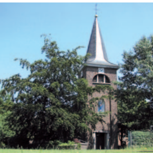
St. Mariä Himmelfahrt Rickelrath