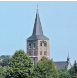
St. Vincentius Beeck