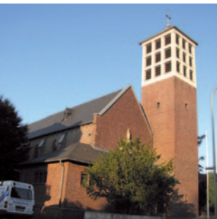
St. Rochus Dalheim