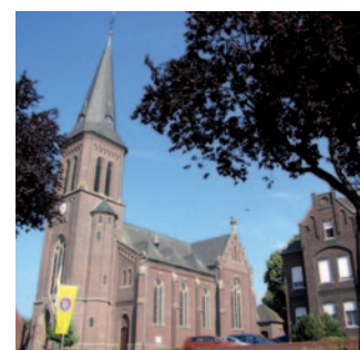
Zur Heiligen Familie Klinkum