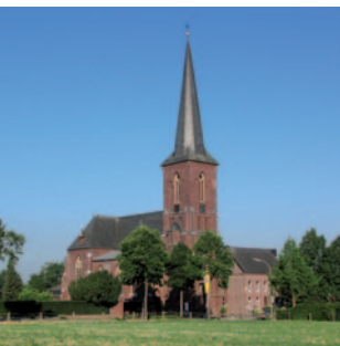
St. Maternus Merbeck